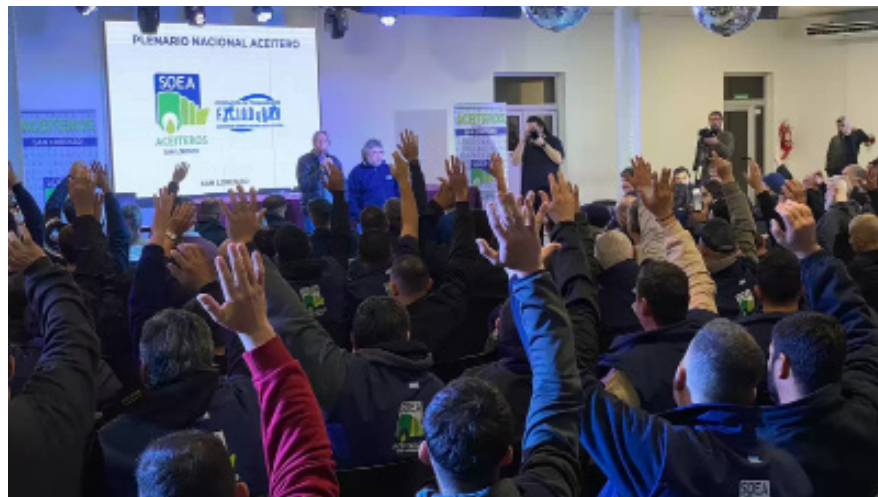
Plenario de aceiteros realizado en julio.

En base a ello, las cámaras empresarias ofrecieron un acuerdo basado en la inflación mensual pero ese cálculo nos hace perder salario manteniéndolo planchado.