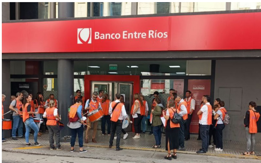
ASAMBLEA. Trabajadores bancarios visibilizaron sus reclamos en las sucursales del Grupo Petersen

Además, el pasado viernes los trabajadores del neumático se movilizaron a la sede del Ministerio de Trabajo ubicada en la localidad de Tigre, en el marco de una audiencia en la que Pirelli