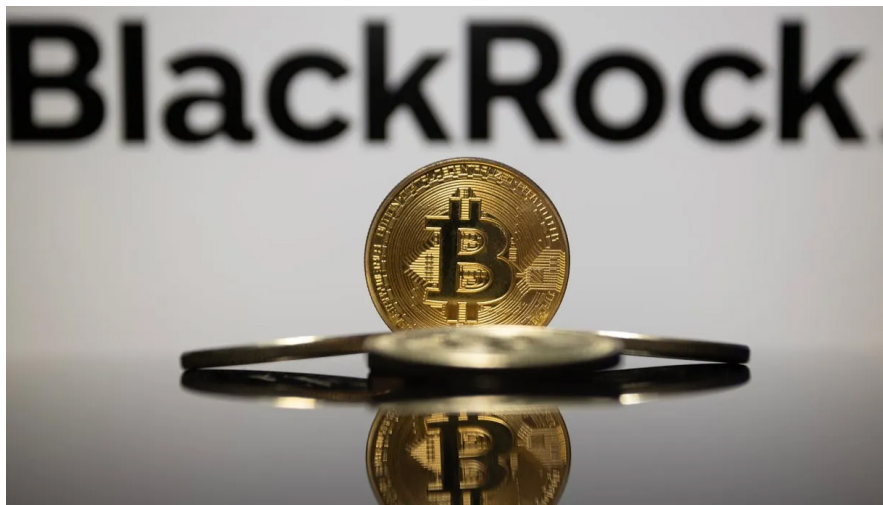
BLACKROCK. El CEO Larry Fink advierte que el dólar podría perder su estatus de reserva global.

Los activos digitales avanzan progresivamente para ocupar un lugar central en las estrategias de inversión y el sistema financiero.