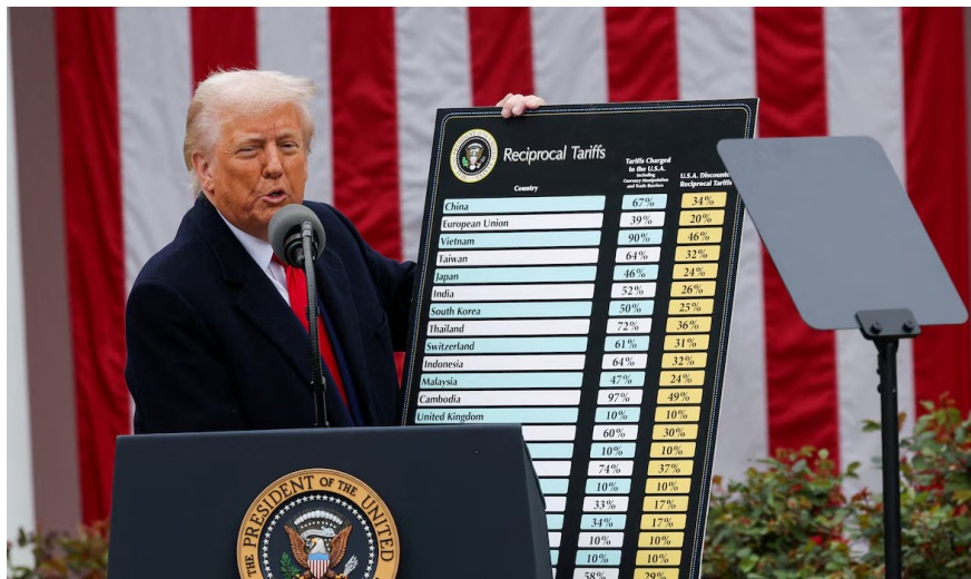
ARANCELES. El anuncio se preveía desde hace varias semanas.

Ello pudo verse al día siguiente del anuncio con la caída de casi 1700