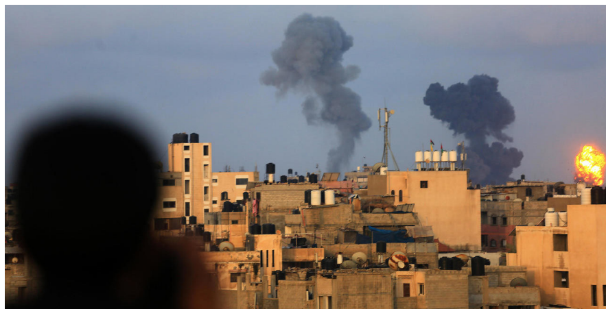
GUERRA. Israel retoma la ofensiva en Gaza.

La situación bélica en Medio Oriente no da tregua. Israel y EE.UU. refuerzan sus posiciones sosteniendo el conflicto militar mientras facciones islamistas dan combate.