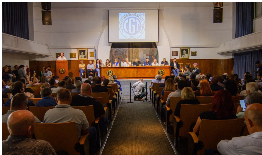
ENCUENTRO. Las regionales propusieron extender la medida de fuerza a 36 hs.

La CGT ratificó el paro y la movilización para el 9 y 10 de abril por paritarias libres, aumento a los jubilados y a los presupuestos de salud y educación. Otras centrales y gremios confirmaron su adhesión.