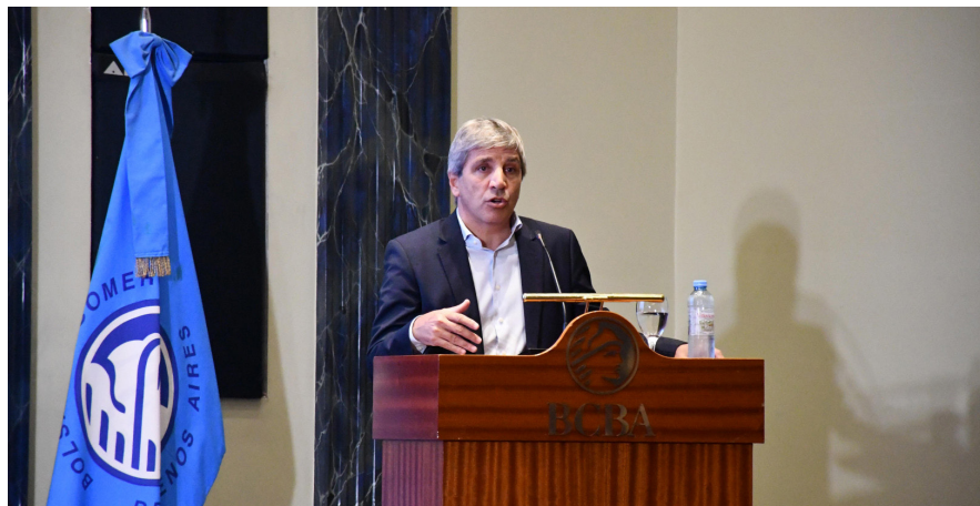
FINANZAS. El ministro habló en el marco de la XXIII Conferencia Anual sobre Regulación y Supervisión de Seguros

A fines de marzo, el ministro de Economía, Luis Caputo, pidió permiso al Fondo para revelar el monto del crédito pedido: $20.000 millones de dólares.