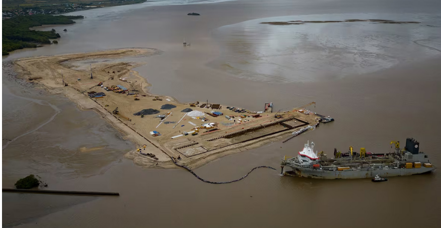
ESEQUIBO. Construcción de puerto costero para extracción petrolera en el río Demerara.

Estados Unidos asedia a Venezuela obstruyendo sus operaciones comerciales de petróleo y gas y apoyando a Guyana en la disputa por la explotación del Esequibo.