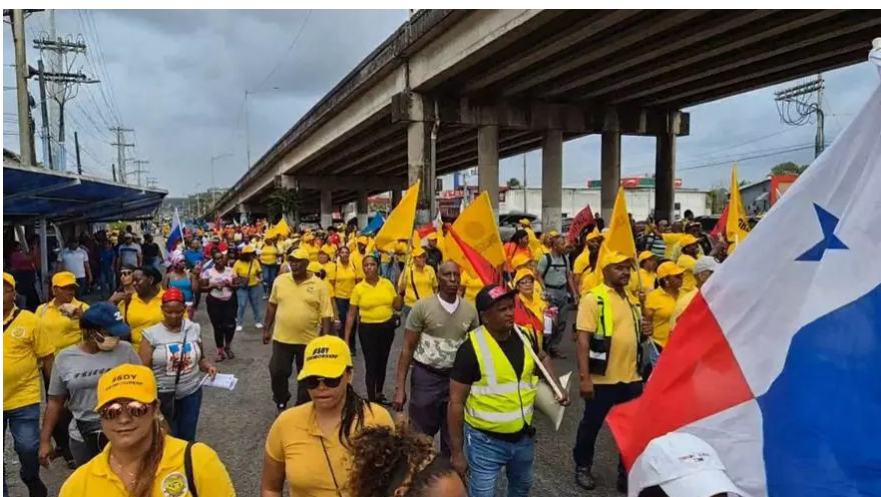
DESACUERDO. Las calles de Panamá repletas de manifestaciones.

Los gremios realizan protestas en todo el país contra las medidas del gobierno de José Mulino y la injerencia estadounidense.