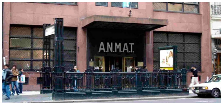
SALUD. Anmat centraliza la función de regular, autorizar, controlar y fiscalizar los productos sanitarios.

El Gobierno anunció la creación por decreto de la Agencia Nacional de Evaluación de Financiamiento de Tecnologías Sanitarias (Anefits).