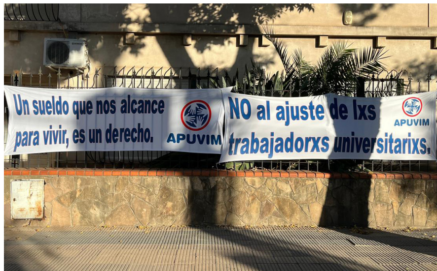
RETROCESO. Los universitarios denuncian el deterioro en la calidad educativa.

Desde comienzo de año resuenan en la ciudad reclamos desde los ámbitos educativos que comparten las problemáticas salariales y presupuestarias.