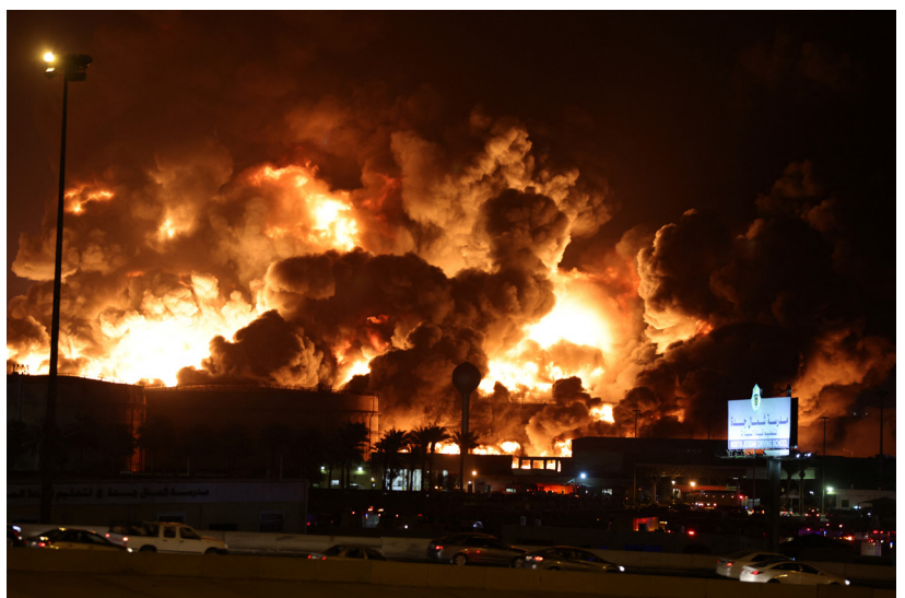
Ataque israelí a petrolera ubicada en Arabia Saudita.

De esta manera, aquel anuncio del presidente Trump, que puso en vilo al planeta entero, parece haber sido un augurio de su propia suerte: el fin de EE.UU. como la civilización dominante bipolar a escala mundial.