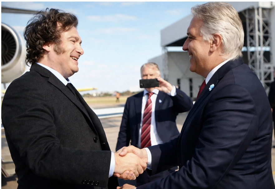
PRIORIDADES. El ajuste en la educación trasciende las jurisdicciones y los partidos políticos.

Los gobiernos profundizan su compromiso con el pago de los intereses de la deuda externa, haciendo oídos sordos a los reclamos por el aumento al financiamiento educativo.