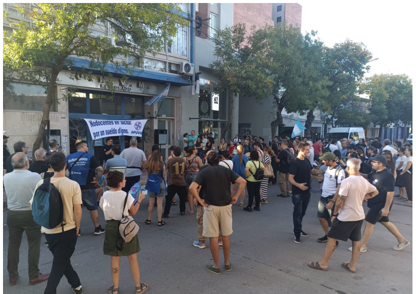
Abrazo simbólico en el Rectorado de la UNVM

En este escenario, queda en evidencia que, aunque surgen en distintos niveles y espacios educativos, todos los reclamos confluyen en las mismas problemáticas estructurales: salarios insuficientes, falta de presupuesto y condiciones que deterioran el derecho a la educación.