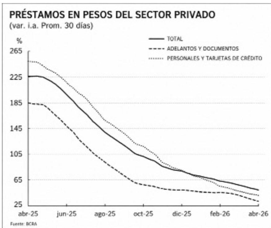
Evolución de los préstamos en pesos destinados al sector privado.

De esta forma, las altas tasas de interés, los salarios a la baja y la expansión del sistema financiero hacen del endeudamiento el único camino posible para sostener el presente, hipotecando el futuro. Por eso, hoy como nunca antes, endeudarse es una necesidad pero también un lujo.