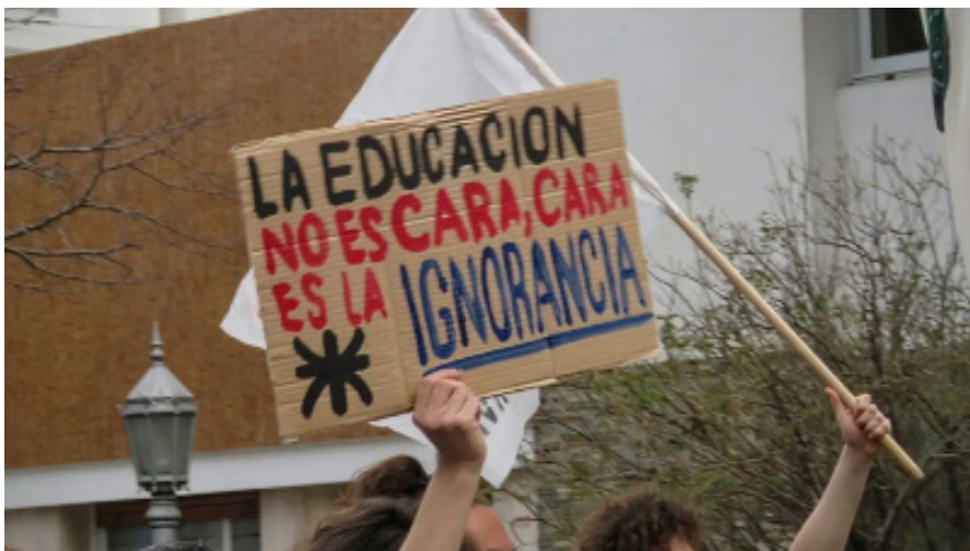
INSTITUCIONAL. La organización en Villa María fue mediante meet.

En un contexto de desfinanciamiento y ajuste, ambas universidades de la ciudad se movilizarán hacia la Plaza Centenario el próximo martes 12.